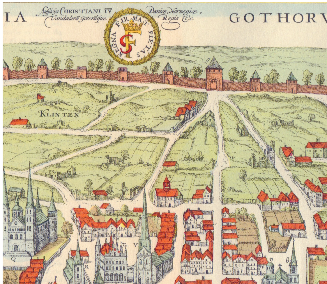
Vårdklockan (X) på Braun-Hogenbergs kopparstick.

Vårdklockan var stadens varnings- och signalklocka, upphängd i ett mindre torn eller en klockstapel. Den ringde vid brand och fara likaväl som vid nattens ingående, då tystnad skulle härska i staden. 1598 invigdes den nya stapeln på södra klinten. Det är denna som namngett dagens Vårdklockegränd.