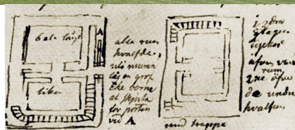
Planritning över huset vid Fredarve av Hilfeling .