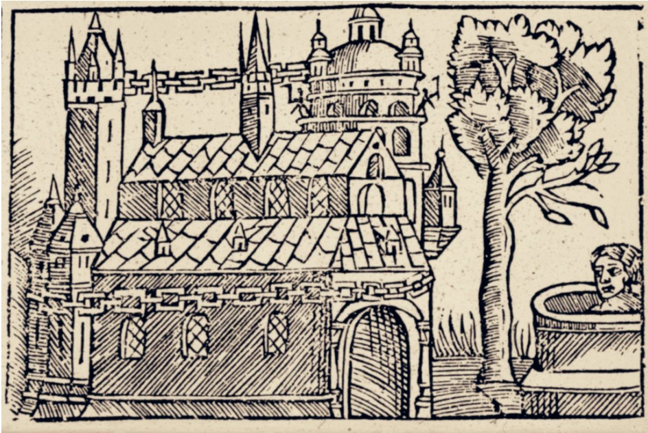
Olaus Magnus' bild av Uppsalen på Domberget.

indikerade det att det måste ha varit det ursprungliga Uppsala. Särskilt som där fanns gamla gravhögar och människor i trakten påstod att det var så. 3