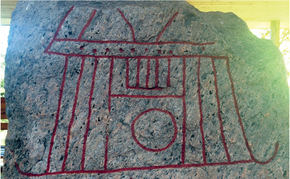
Uppsalen så som den sannolikt framställs på Sparlösaastenen med eldhärd och förfädersstolpar.

Vad som är viktigt är emellertid vad namnet Uppsala egentligen emanerar från och där får vi en tydlig ledning av Adam av Bremen, vilken på två ställen uttryckligen säger att det är templet som kallas Uppsala. 4 Ytterligare stöd får det i Ynglingasagan, i berättelsen om Ingjald Illråde, då denne skulle ställa till gravgästabad efter fadern Anund och det anges att han ” lät bygga en sal, som var lika stor och praktfull som själva Uppsalen (min emfasering) och kallade den Sjukonungasalen ”. 5 Oavsett sanningshalten i själva berättelsen bekräftar det att det var hovet där kulten landsomfattande firades som ursprungligen kallades ”Uppsala”/”Uppsalen”. Vi har alltså två från varandra oberoende källor som anger själva templet som ”Uppsala”. Därtill uppger även Ericus Olai att templet hette ”Upsala”. 6 Att sentida hypoteser ifrågasätter detta är tämligen ointressant, åtminstone enligt Ockhams rakkniv, då det är just obestyrkta hypoteser. Att templet också var ”Uppsalen” är helt följdriktigt av att en ”sal” förefaller ha varit en sakral byggnad, medan däremot en hall tycks ha varit världslig. 7 Namnet var därför, utifrån sin heliga status, självklart symboliskt viktigt för att binda upp de nyomvända när stiftet upprättades och domkyrkan uppfördes. Därför var det naturligtvis följdriktigt att det med sin övergripande symbolik överfördes på desamma.