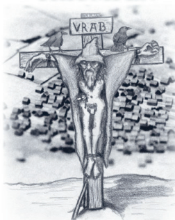
En gotländsk medeltidsroman av: DICK WASE