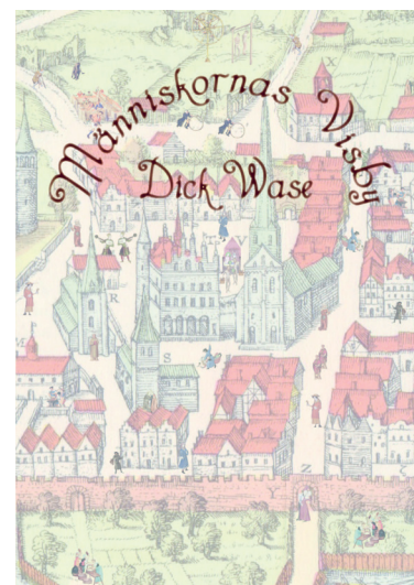
Människornas Visby, den överlägset bästa guiden till Visbys medeltidshistoria.