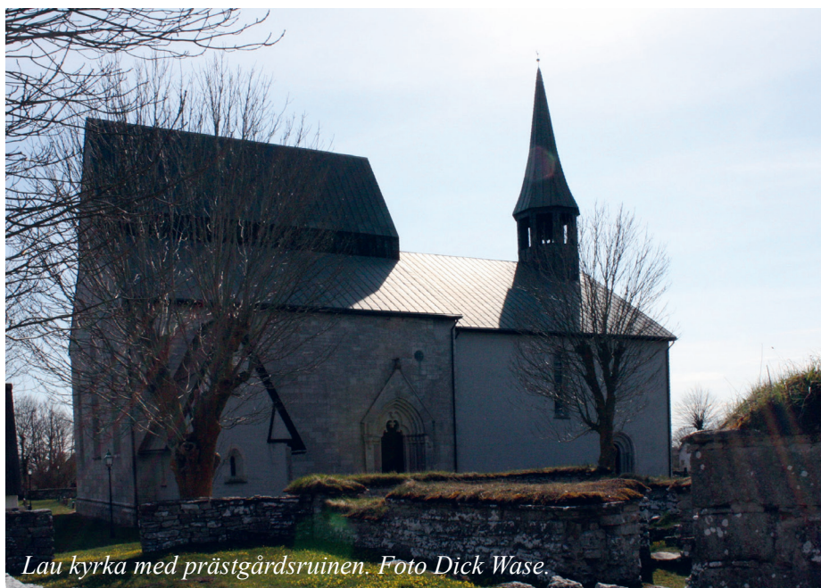
Lau kyrka med prästgårdsruinen.

I taxuslistorna har socknen en avgift om 3 mark.