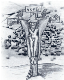
En gotländsk medeltidsroman av: DICK WASE