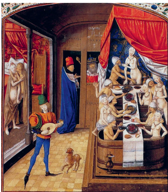
Interiör från burgundiskt badhus på 1400-talet.

Tack vare nypuritanismen från omkring 1480 så stängdes badhusen runt Europa under 1500-talet och den personliga hygienens undergick en väldig försämring fram till det senare 1800-talets nya idéer och upplysning.